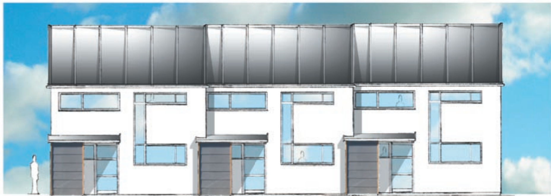
BOLIG TYPE B - 111m2 FACADE mod vej