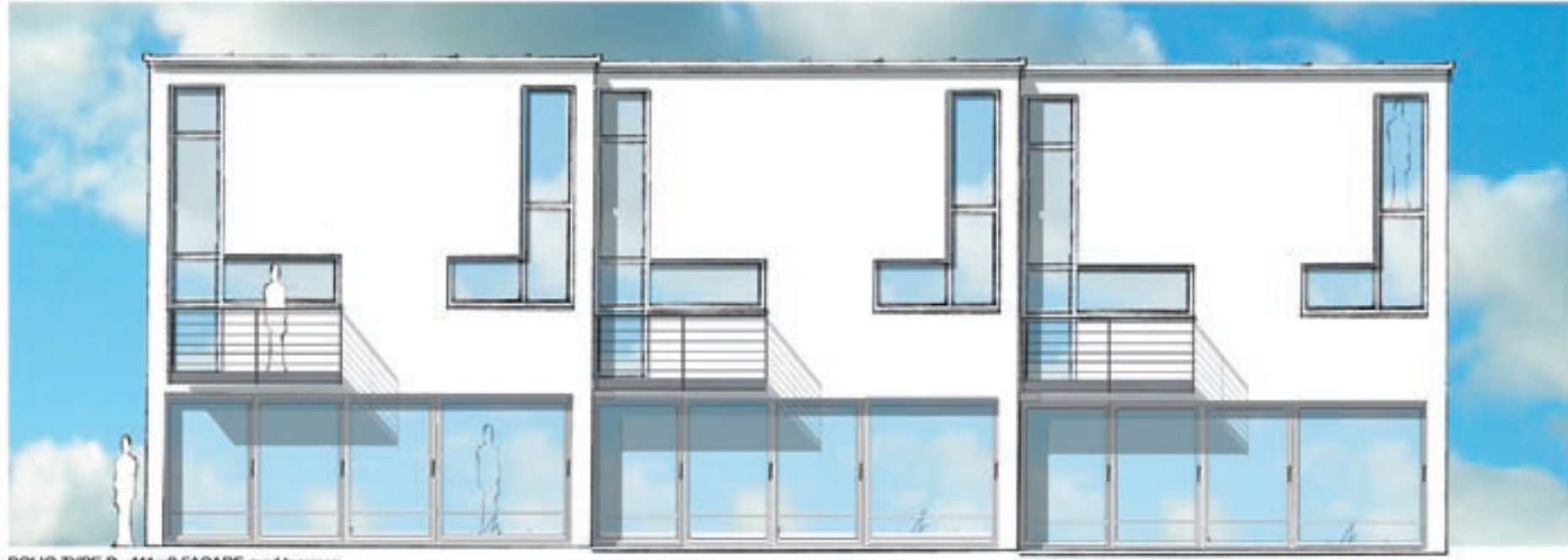
BOLIG TYPE B - 111m2 FACADE mod terrasse