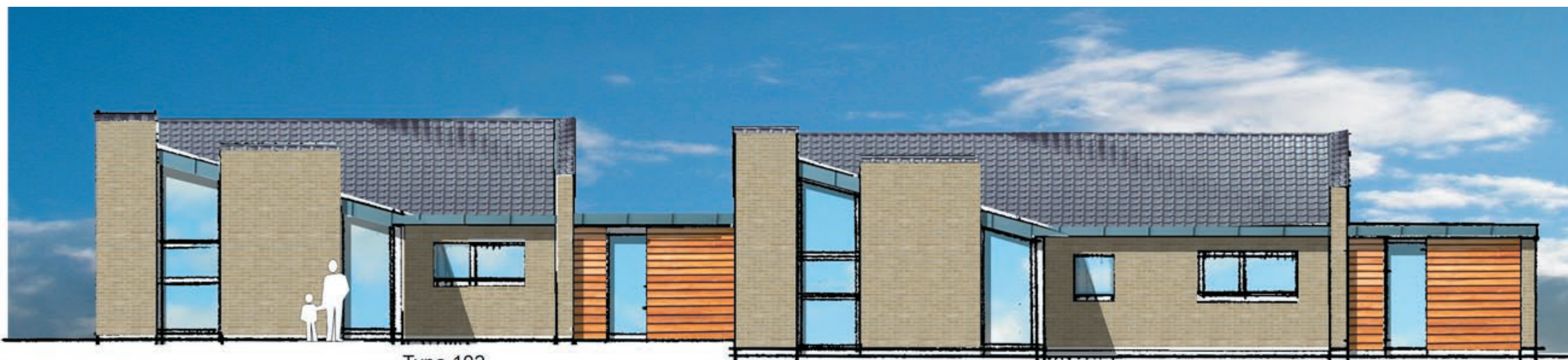
Facade mod Have